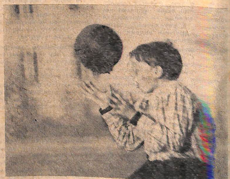
еще не настала минута расставания, и каждый в лагере находит себе занятие по душе.