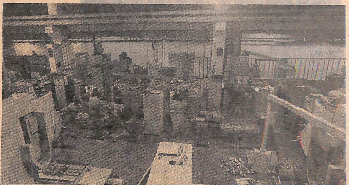
Участок цеха № 1. Прогрессивные станки с ЧПУ типа МА-655 (класс обрабатывающих центров). Все-что в цехе 12 таких станков, на которых обрабатываются детали, оснащенные программами. Один рабочий одновременно обслуживает три станка.